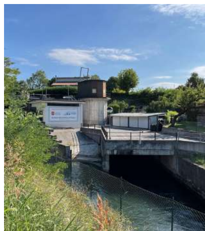
♦La centrale elettrica di Salago, sul salto della Roggia Lonata.

A valle di Ponte San Marco il Chiese mantiene una leggera depressione rispetto al livello della pianura. Il varco è abbastanza ampio da consentire alcuni larghi meandri che vivacizzano il paesaggio. Dal letto del fiume affiorano le ghiaie e si mostra qualche lembo di spiaggia. La scarpata è fittamente vegetata e nasconde i campi a cereali. Un tempo le campagne erano più parcellizzate e, secondo le vecchie stampe, qui preva-