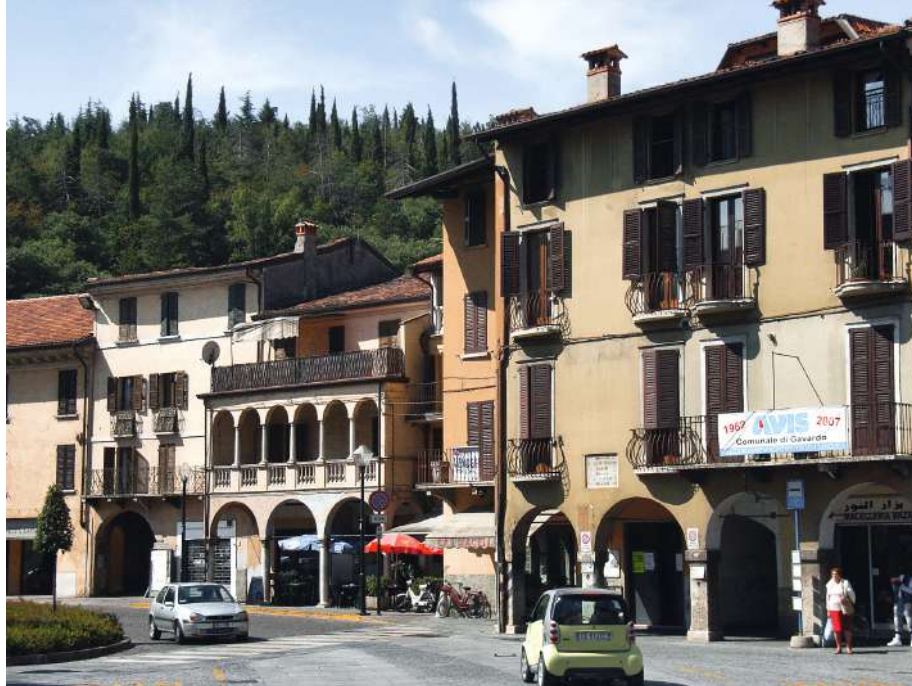
♦Le palazzine porticate di Gavardo.

di là sono ancora le basse e tenui colline verdeggianti, e di qua le pendici rocciose e spoglie quasi anche di rada macchia. Ma davanti - dove la piana, restringendosi sempre più tende a finire, - si vede già continuarsi la valle del Chiese come un incisione angusta tra le opposte poggiate, con lo sfondo di monti più alti ed anche più aspri: sono quelli che col versante verso il Garda sovrastano a Salò ed a Gardone».