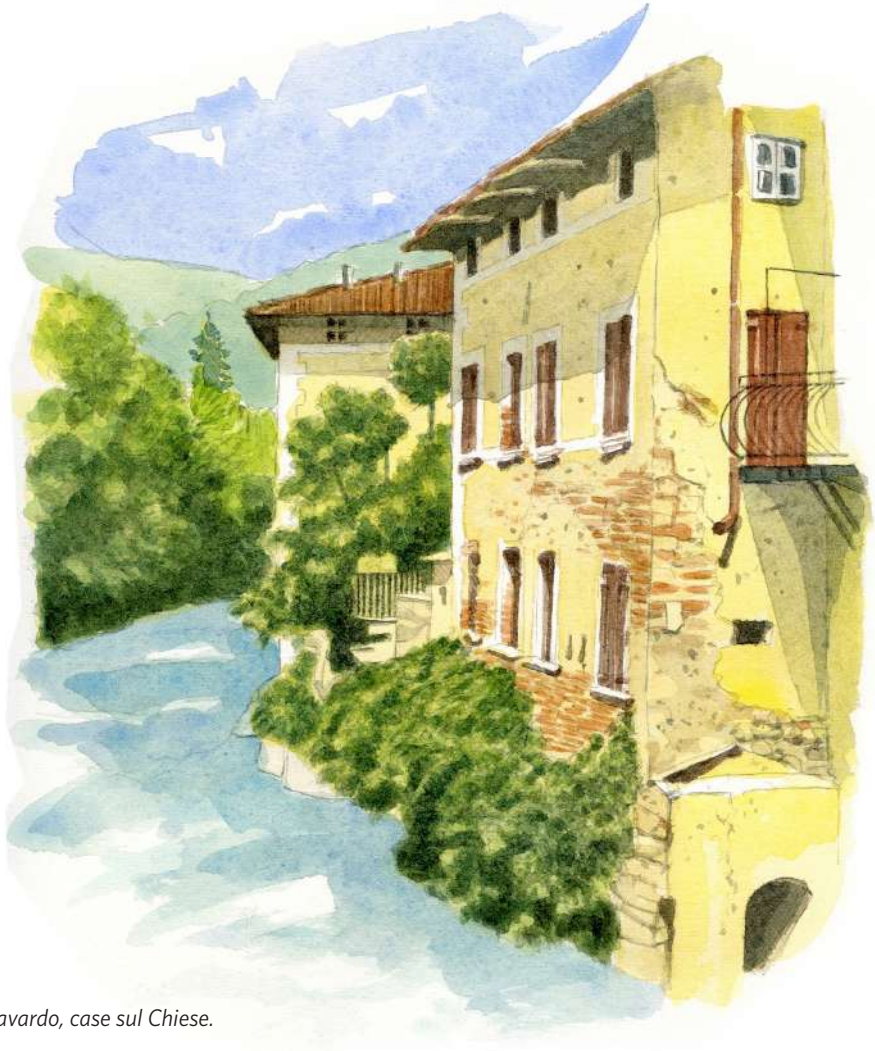
♦ Gavardo, case sul Chiese.

«Siamo ormai vicini al termine dello sfocio della valle del Chiese - recita una guida automobilistica degli anni '20 del secolo scorso - alla destra si distende ancora una breve piana, sempre più ristretta tra le opposte colline, ma sempre con le solite colture, a granturco e a gelsi prevalenti, con filari di viti più fitti presso ai villaggi. E al