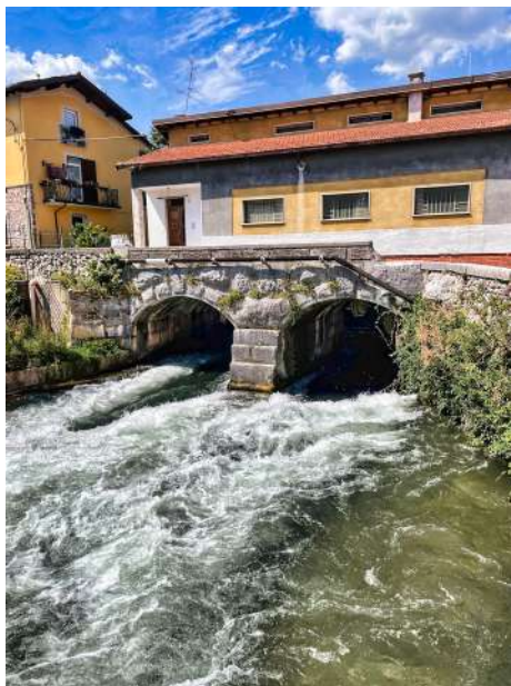
♦ L'edificio regolatore del Naviglio alle Arche.

seguire le indicazioni ciclo-segnalistiche per Salò che portano, verso sinistra, sulla vecchia Via Gardesana. Il rettilineo immette nell'abitato di Gavardo e consente, giusto accanto a un negozio di biciclette, di imboccare a destra lo stretto Vicolo Beveraggio che, tramite un ponticello pedonale sul Naviglio, accede all'Isolo, una stretta lingua di terra fra il Chiese e il Naviglio stesso destinata a giardino pubblico. È il luogo ove riposare dopo la pedalata e dove godere di un paio di belle vedute. Ad esempio sulla schiera compatte di vecchie case con le finestre affacciate al Naviglio che fanno comprendere quanto sia vincolante il legame fra il corso d'acqua e il disegno urbanistico dell'abitato.