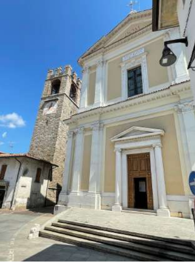
♦La chiesa di San Zenone a Prevalle.

segno di un benessere che si evidenzia nella cura della cosa pubblica. Siamo molto distanti dalle descrizioni di fine Ottocento, quando, dove oggi ci sono ville e villini, si raccoglievano prodotti di un suolo fertilissimo «ben irrigato dal Naviglio Bresciano, con cereali, foraggi, viti, gelsi, frutta e ortaglie» e anche olive sulle prime alture. In passato, il Comune - col nome di Goglione, da "goio", gorgo - era diviso in due distinti nuclei (Sotto e Sopra), oggi non più distinguibili se non per la posizione delle relative chiese. La più importante è quella intitolata a San Zenone, ampliata nel 1818, ma di cui resta, isolato, il bel campanile cinquecentesco dall'aspetto turrito. Nella chiesa si ammira un'opera di Palma il Giovane con l'Assunta e i santi Zenone e Carlo . Ottimo spunto per parlare del vescovo Zenone, venerato a Verona col nome di Zeno, poiché si dovette a lui la salvezza della città da