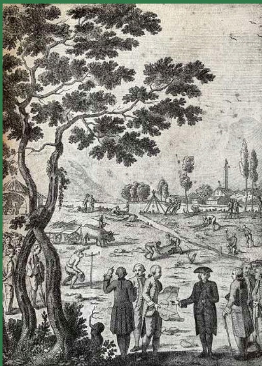
♦«Berardo Maggi vescovo e Governatore di Brescia, accompagnato dagli Anziani della Città, alle sponde del Fiume Chiese sotto Gavardo, fa eseguire l'estrazione del Naviglio, anno 1288»

Il nome di Naviglio fa chiaramente intendere che si trattava di una via navigabile per il trasporto delle merci e, in particolare, del legname fluitato dai boschi dell'alta Val Sabbia e della Val Caffaro. Nel 1367 l'acqua scorreva da Gavardo fino all'Oglio, mentre a Brescia era ubicato un porto presso l'uscita della Strada Mantovana, detto di San