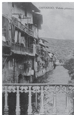
♦Le case di Gavardo. affacciate al Chiese in una cartolina d'inizio Novecento.

dell'attiguo Museo archeologico della Val Sabbia , espressione tangibile delle ricerche paleontologiche condotte negli anni dal Gruppo Grotte Gavardo. Per tornare al tema idraulico, dal ponte si può seguire la caratteristica Via Molino, dai bei portoni decorati e con piccoli affacci sotto vòlta verso il Chiese. Sul fondo della via si accede, verso sinistra, al mulino di Gavardo , forse la più singolare testimonianza rimasta delle opere connesse all'uso delle acque. Il mulino è al vertice dell'itinerario ma, se si vuole, si può anche risalire la sponda opposta (occorre ripassare il ponte) e dirigersi verso la frazione Sopraponte dove si osserva il punto esatto di bipartizione delle acque del Chiese e del Naviglio. Il tragitto di ritorno, verso Brescia, avviene a questo punto lungo la ciclabile che si può imboccare già fra le case di Gavardo se si percorre Via Sormani e passando dinanzi all'edificio delle Arche.